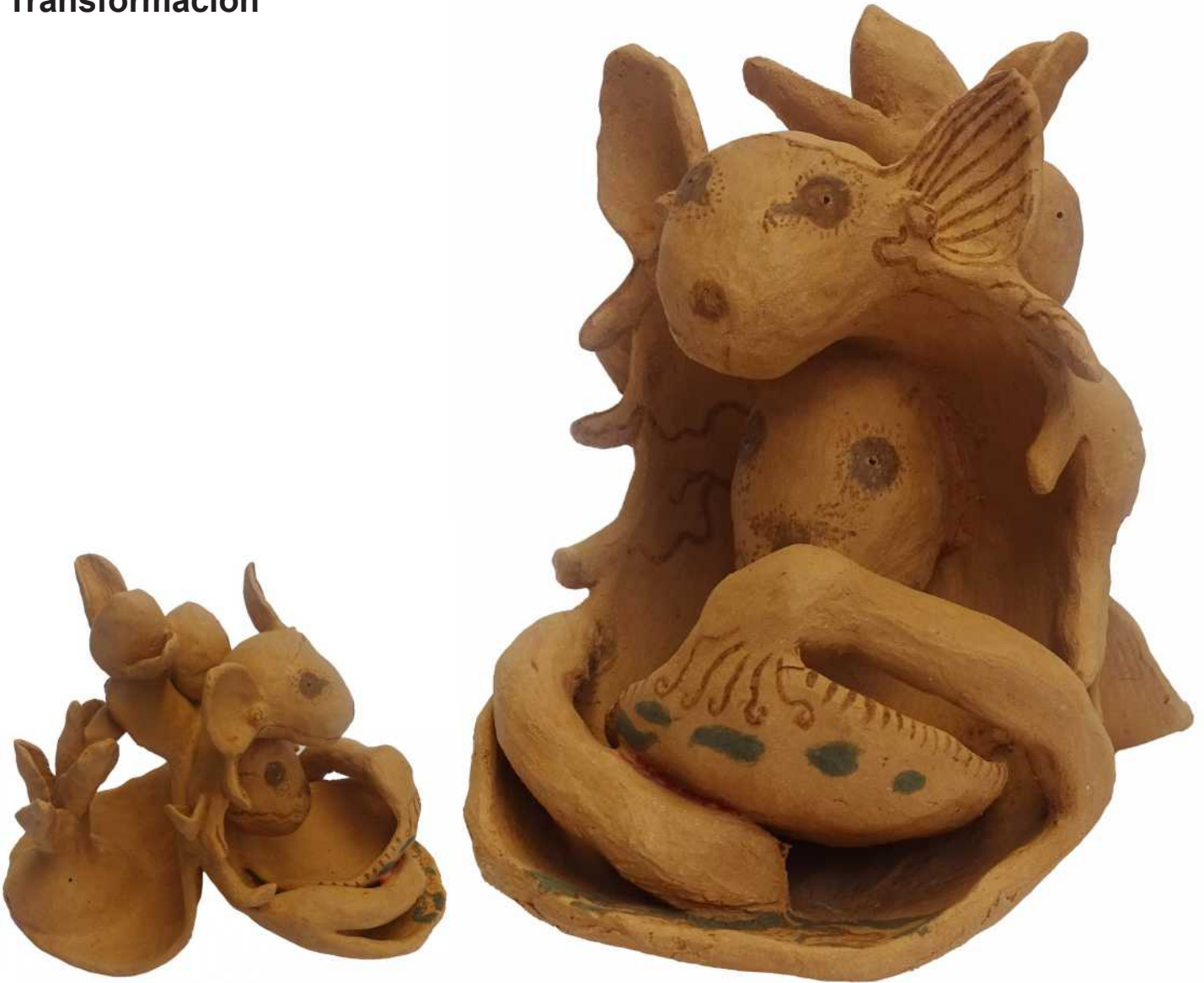
Escultura, barro de la Selva 2022 18 x 20 x 14 cm

Se cuenta en la comunidad que cuando un ratón quiere transformarse en un murciélago, antes tiene que enfrentarse a las pruebas de la naturaleza, tiene que ponerse a la orilla de la carretera. Cuando esté pasando un carro tiene que cruzar con tres saltos para la otra orilla del camino, si logra cruzar entonces será un murciélago, y volará por los cielo. Será un polinizador y distribuirá las semillas de las frutas. Pero si falla en dar los tres saltos, lo atropellan o se paraliza por miedo antes de cruzar, perderá la vida.